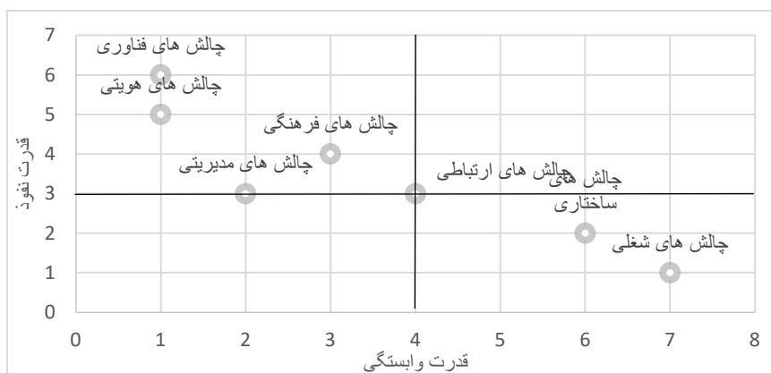
شکل ۲: نمودار تحلیل MICMAC

ارتباطات اندکی با دیگر متغیرها دارند و ارتباط آن‌ها با سیستم قوی نیست قرار نگرفته‌اند این مطلب حاکی از انسجام قوی چالش‌ها با یکدیگر و اهمیت همه چالش‌های پیشایندی حضور کارکنان نسل Z در سازمان‌های دولتی دارد با توجه به جهت پیکان‌ها می‌توان مدل به‌دست‌آمده را به این صورت تفسیر کرد که چالش‌های فناوری و هویتی به‌عنوان اصلی‌ترین